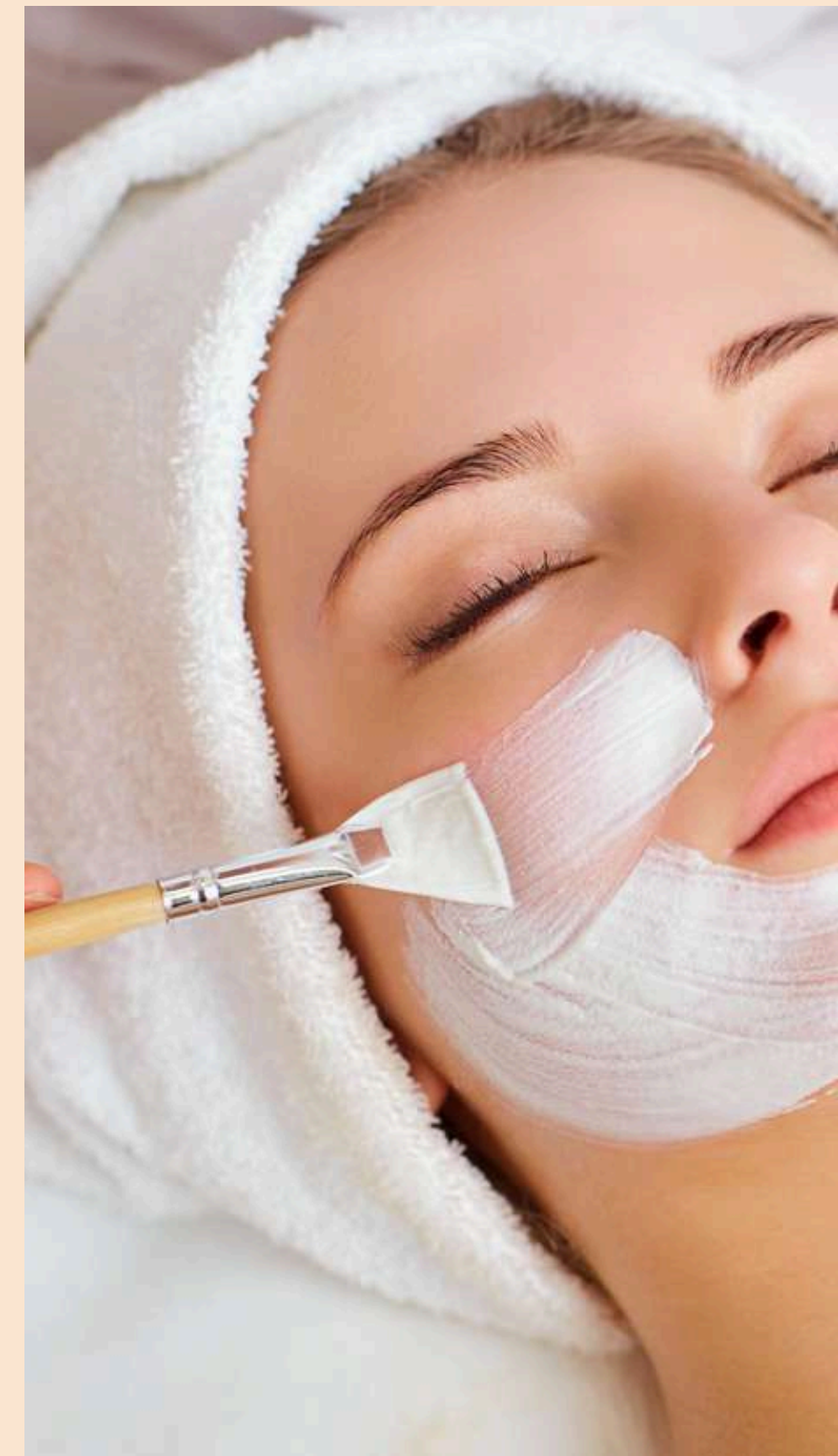
Cosmètica a la venta : Scens Organic & Vegan